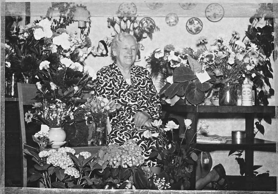
Nogle enkelte af mine blomster par 70 års fødselsdagen 23 Juni 1954