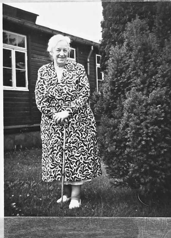
10m Søndag på røde Kors Folkekurs Kald.